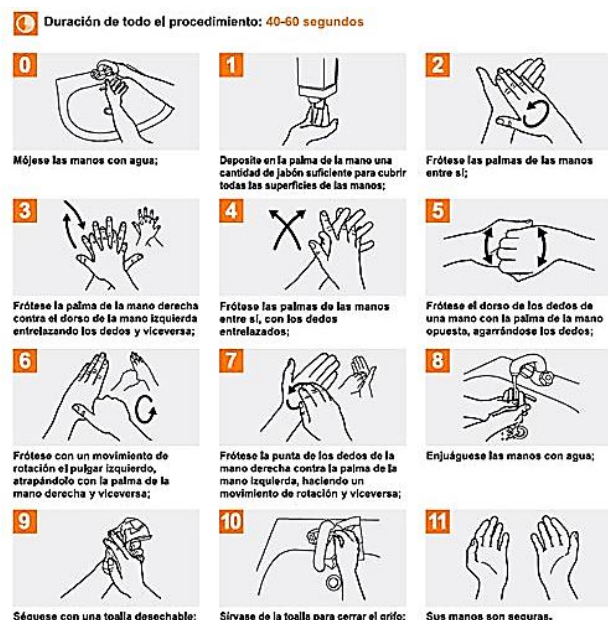
Imagen 1. Guía de ¿cómo lavarse las manos?